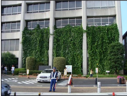
川越市役所本庁舎