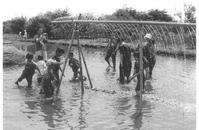
④子どもたちがどろんこ遊びできる場も設置