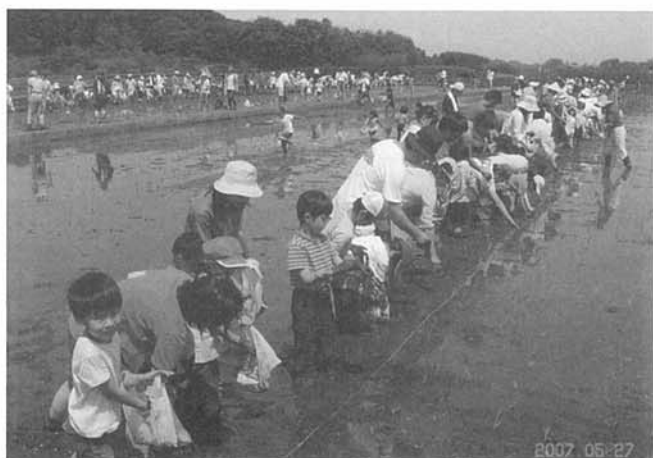
①見沼たんぼで米作り体験活動を実施