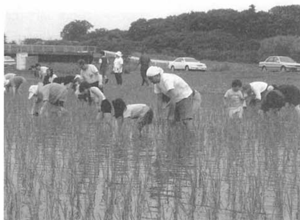
②田の中に入って草取り