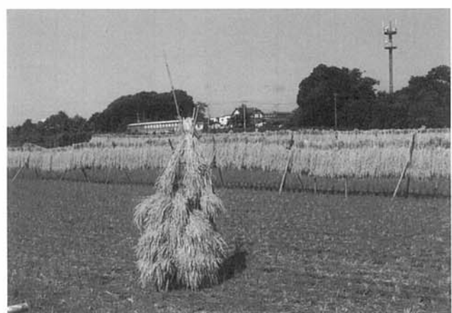
⑧刈った稲を天日干し