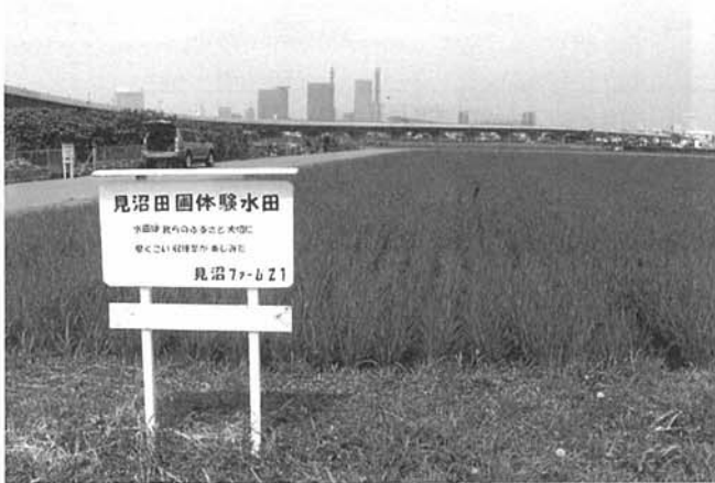
③新都心を遠望する見沼たんぼ