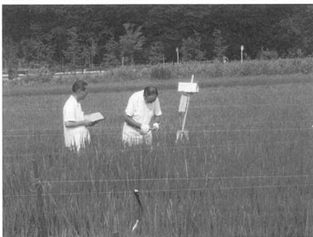
⑤水田の気温を測ってみた