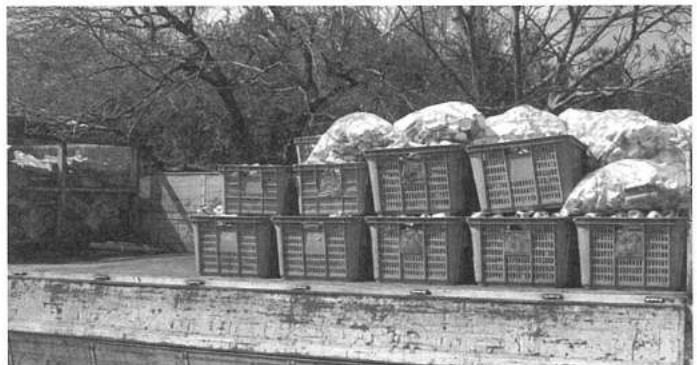
⑧回収したアルミ缶