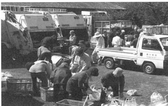
⑦回収業者に引き渡し