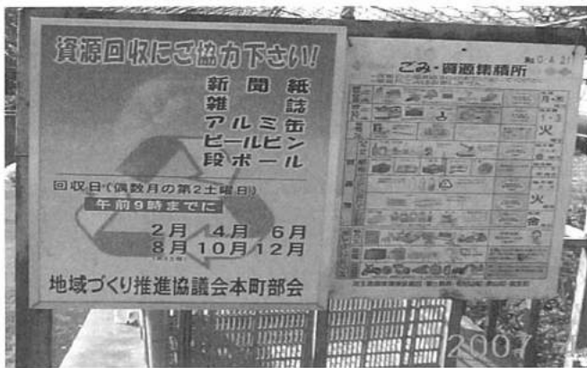
③集積所に看板を掲示