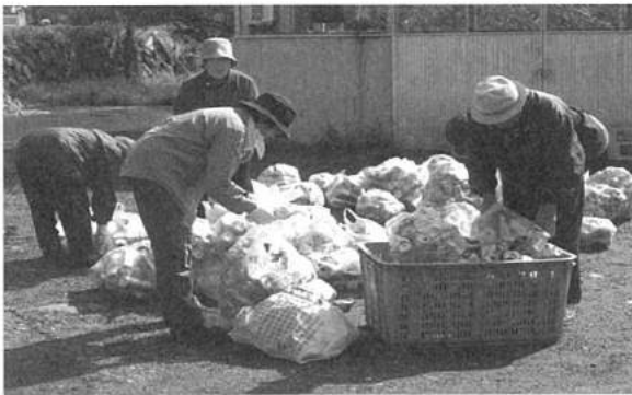
⑤スチール缶の混入がないか点検