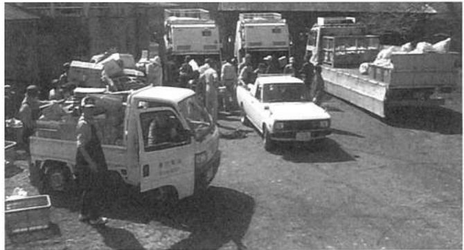
⑥トラックを出して集積所から回収