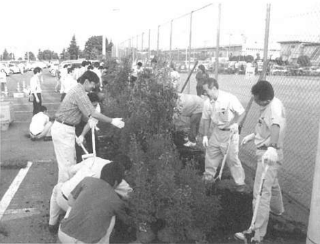
④従業員による植樹活動