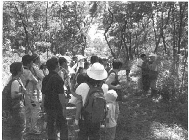
③エコウォーキング