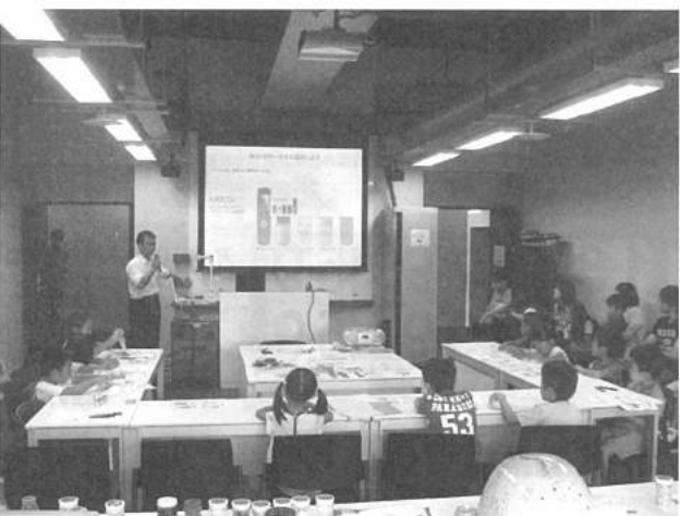
⑥小学生に環境学習の場を提供