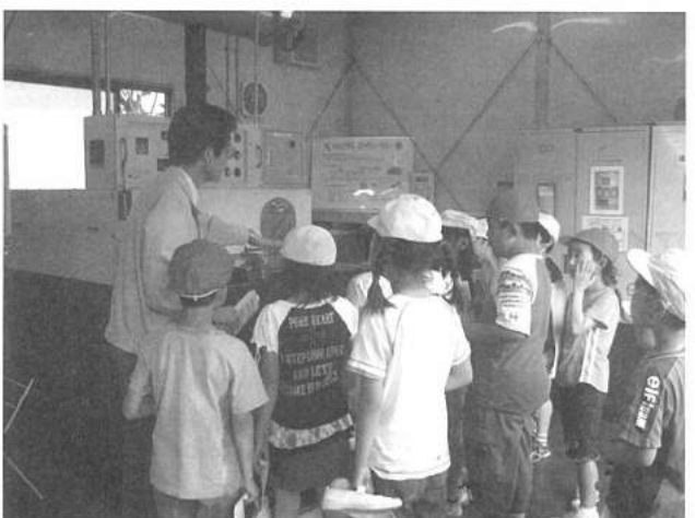
⑦リサイクルの見学