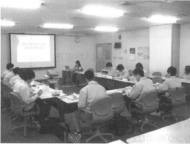
②環境教育を部門別に実施 受講率100%