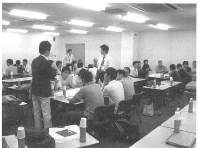
⑤大学院生とディスカッション